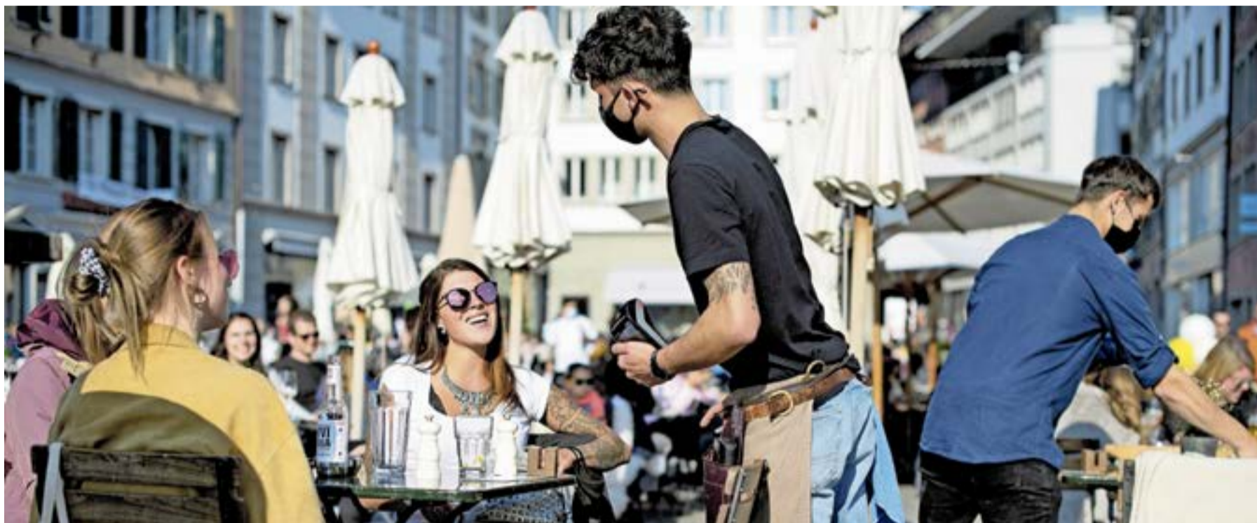
Wie hier im Mill'Feuille in Luzern waren die Sonnenplätze auf den Restaurantterrassen diese Woche gefragt.