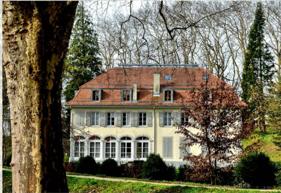
Château de Dorigny, Salle 106 Métro M1 - Arrêt Chamberonne